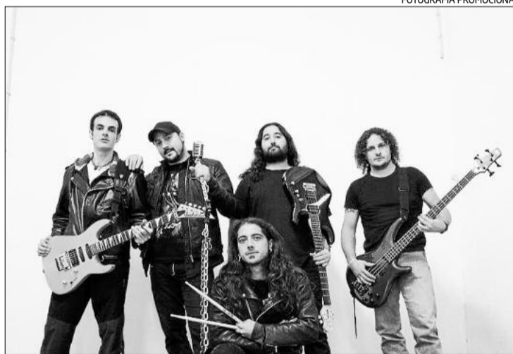
Els integrants de la banda Els Senyors de les Pedres

banda de tribut de Sangtraït. Per retre homenatge amb fidelitat a la carismàtica formació heavy de la Jonquera, un dels emblemes de l'anomenat rock català dels anys 80 i 90, el trio es va ampliar, però la composició actual no es va concretar fins a final del 2011 amb la incorporació de dos nous components, Javi Gianno (veu) i Hèc-