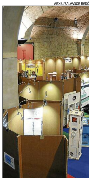
Aspecte de la Llotja, l'any passat

Fins al 30 de setembre, el mercat manresà ofereix descomptes per a la compra de les entrades, que es poden adquirir a les taquilles del Kursaal, per telèfon (93 872 36 36) i al web de la Fira Mediterrània ( www.firamediterrania.cat ). Les entrades dels concerts de la sala Stroika es venen a Sibeliu, Solans, Cal Manel, Ítaca i al web www.stroika.cat .