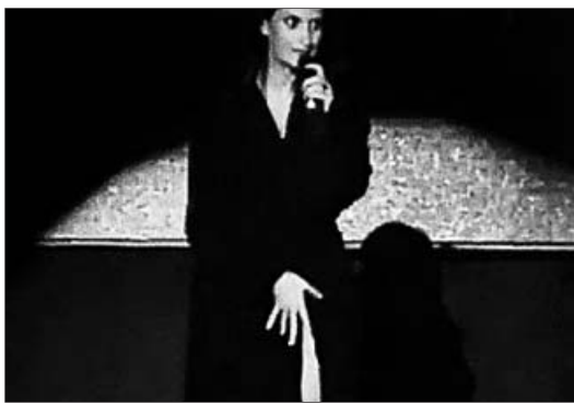
LAURA PAUSINI La cantante sufrió un percance durante un concierto en Lima: salió a cantar en albornoz y este se abrió dejando al descubierto sus partes íntimas.