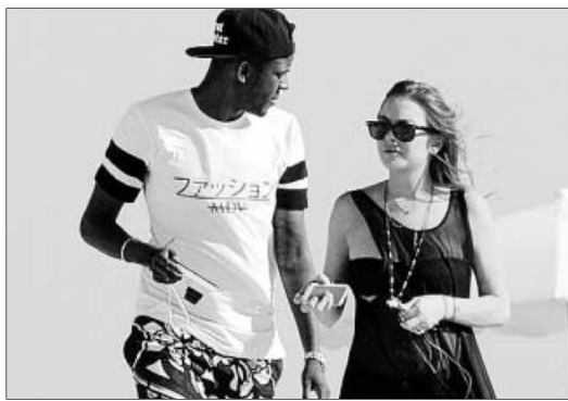
LINDSAY LOHAN La discolorada actriz está pasando sus vacaciones en Ibiza, donde se la ha visto muy relajada y alejada de las discotecas.