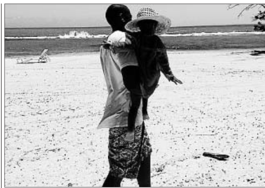
BEYONCÉ Con esta imagen en Instagram (en la que se ve a su marido Jay Z junto a su hija Blue Ivy), la cantante quiere desmentir los rumores de ruptura.