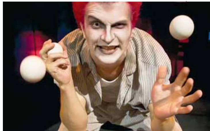
Circ i 'gore'. 'Manicomio de los horrores'. DYP

Lloc i dies: A La Seca, fins al 10 de novembre.