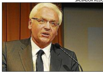
El conseller Ferran Mascarell

■ Talent, creació i emprenedoria. Tres atributs per als guardonats d'ahir que, en paraules del conseller de Cultura, Ferran Mascarell, conformen un «cercle virtuós que fa funcionar un país». Uns premiats que «dimensionen el que aporta la Catalunya Central al conjunt del país». Mascarell va cloure l'acte de lliurament dels Premis Regió7 amb una metàfora sobre com «construir un país millor». Ho va fer a través de la imatge d'un cercle on al costat del talent hi ha d'haver entitats, empreses, ajuntaments i l'administració nacional. I una paraula bàsica «cooperació», de moda als Estats Units i, va dir irònicament, inventada pels catalans ja al segle XIX