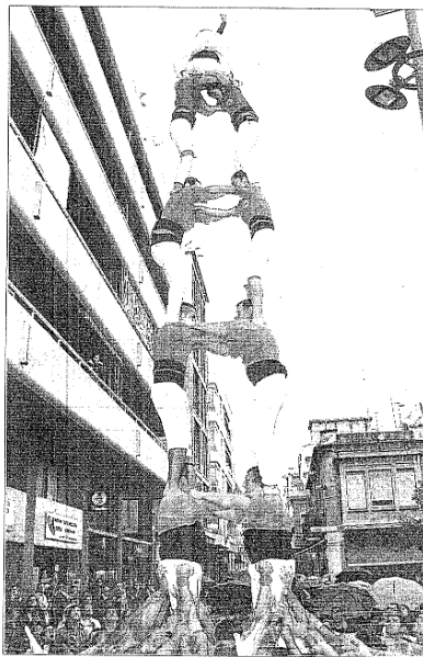
Dos de set carregat dels Minyons de l'Arboç ahir al migdia en la diada del 40è aniversari dels Bordegassos de Vilanova.

I a Vilanova, també ahir al migdia, els Bordegassos van celebrar els seus primers quaranta anys de vida amb una diada castellera, acompanyats d'algunes de les agrupacions que ja existien l'any de la seva creació, el 1972.