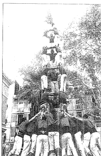
Tres de nou coronat pels Castellers de Barcelona ahir al migdia en la diada de la Festa Major del Clot.

CASTELLS ■ LA DIADA DELS XICS DE GRANOLLERS I LA DE LA FESTA MAJOR DEL BARRI BARCELONÍ DEL CLOT, LES MILLORS DEL CAP DE SETMANA