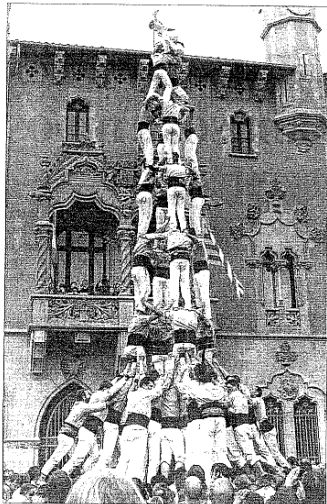
Quatre de nou bastit pels Minyons de Terrassa ahir al migdia a la plaça de la Porxada de Granollers.