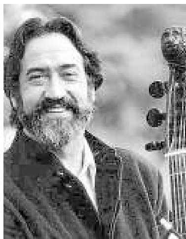
El músico Jordo Savall.