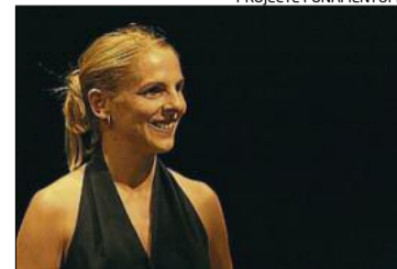
L'actriu Sandra Monclús