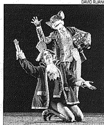
Un moment de l'espectacle