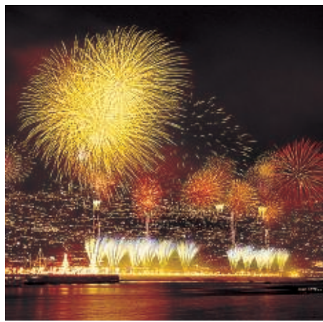
Fuegos artificiales de Nochevieja en Funchal (Madeira).

La cadena de hoteles baratos Travelodge, una de las más populares en Reino Unido, lanza una oferta para alojarse este otoño en sus seis establecimientos en España