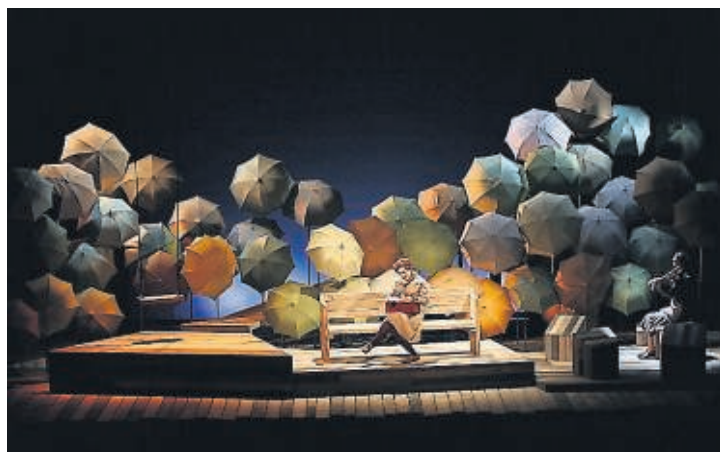
Kafka i la nina viatgera, uno de los espectáculos de la XVI Fira Mediterrània, en Manresa.

Jordi Savall, acompañado de voces y músicas de Israel, Turquía, Bulgaria, Grecia y España, protagoniza el concierto inaugu-