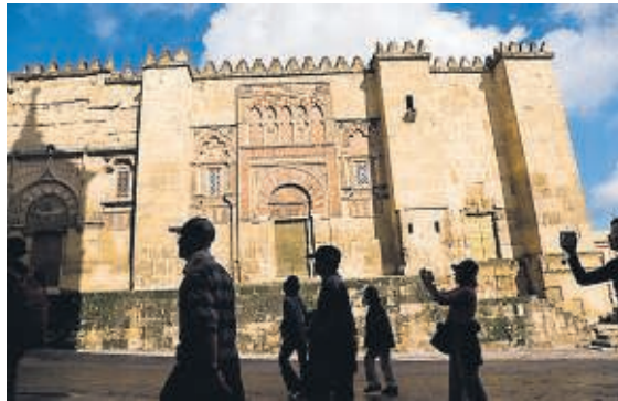
Mezquita de Córdoba, erigida en el año 780. A la derecha, Dubrovnik, Croacia.