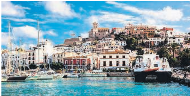
Puerto deportivo de Ibiza.