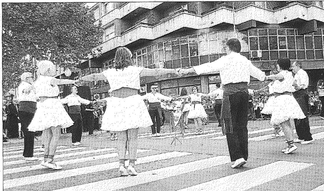
Imatge d'una ballada de sardanes de l'Onze de Setembre d'enguany a Manresa

El fi de festa el protagonitzarà la flashmob . La música, que ha creat la Cobla Ciutat de Cornellà, i que interpretarà en directe, es basa