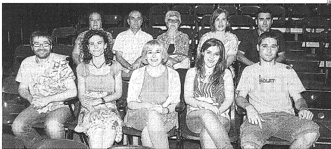
Responsables de les companyies i del teatre igualadí, ahir, després de la presentació del cicle

► Durant aquest mes passaran per l'escenari igualadí tres companyies de la comarca ► Feia deu anys que la iniciativa havia deixat de celebrar-se