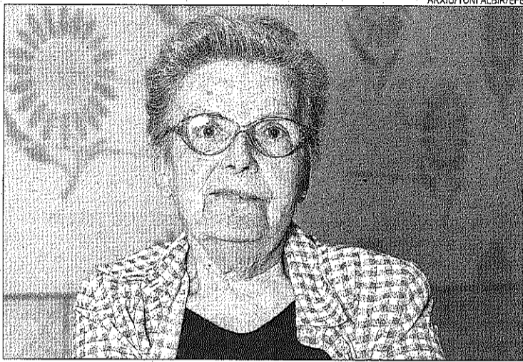
El darrer llibre de Pàmies va ser un homenatge al seu marit, López Raimundo