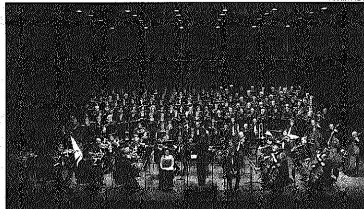
Un moment del concert, diumenge, al teatre Kursaal de Manresa