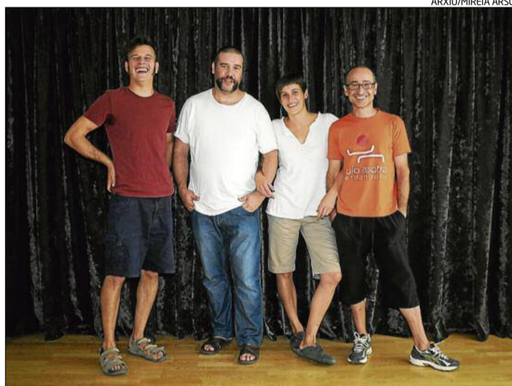
Membres del nucli directiu de l'associació manresana La Crica

La Crica va néixer a final del 2009 i ha fet de la sala Sant Domènec, ubicada al teatre Conservatori,