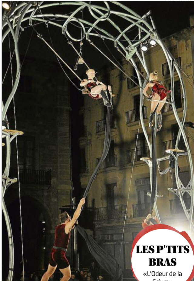
LES P'TITS BRAS «L'Odeur de la Sciure»