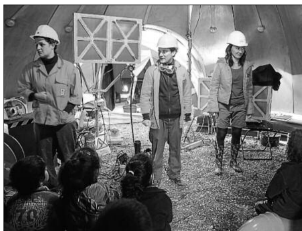
«Lava» va seduir el públic infantil a la vela del Casino