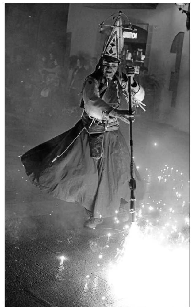
Foc i dansa en la rua de carrer de la companyia Karnavires