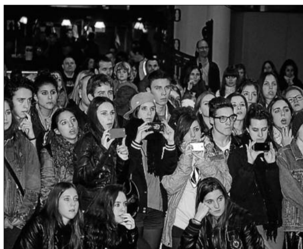
L'actuació de Kulbik Dance va aixecar expectació