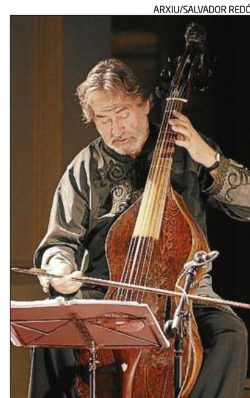
El músic igualadí Jordi Savall

El 1987 va crear la Capella Reial de Catalunya, formació especialitzada en la interpretació de música religiosa, i el 1989, l'orquestra barroca i clàssica Le Concert des Nations, amb repertoris que van de l'edat mitjana al segle XIX. Ha actuat arreu del món, ha dirigit formacions de prestigi i la seva discografia supera el centenar d'enregistraments. El 1997 va impulsar el Centre Internacional de Música Antiga i el 1998 el segell Alia Vox. L'any passat, Savall va ser l'artista convidat de la Mediterrània.