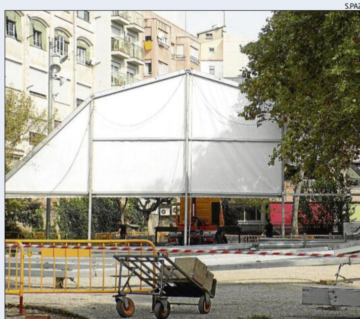
Aspecte dels preparatius del muntatge de la vela Taverna Damm

Amb capacitat per a 800 persones, la vela tindrà un espai gastronòmic, abans a Sant Domènec