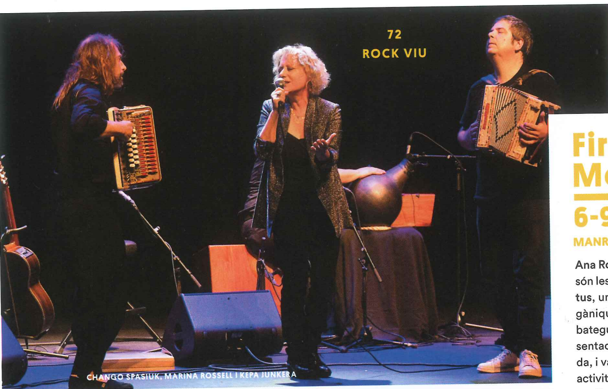
CHANGO SPASIUK, MARINA ROSSELL I KEPA JUNKERA