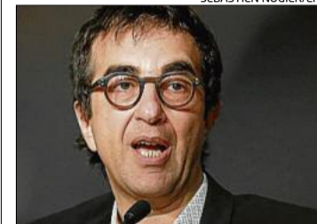
El director Atom Egoyan