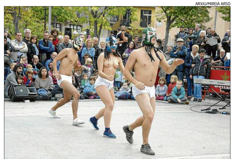
► ERTZA: «El show del espectador». Estupefacció i sorpresa va causar l'espectacle de la companyia basca perquè els tres actors van aparèixer davant el públic coberts tan sols amb roba interior inferior. Un inici singular per a un muntatge de dansa-teatre que reflexiona sobre la posició de l'espectador en la contemplació de l'obra d'art.