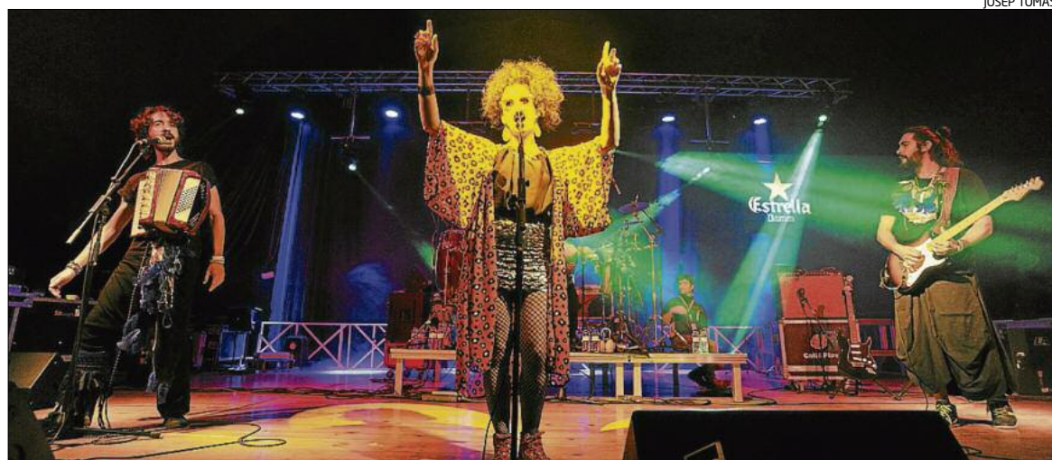
Música festiva arribada d'Argentina, divendres a la nit a la taverna Estrella Damm de la fira

► RIU: «Abans tot això eren camps». La taverna del Casino es va anar omplint per escoltar el grup Riu, del Baix Llobregat, que va presentar el seu tercer disc. Els vencedors del Concurs Sons del Mediterrani del 2011 van combinar melodies instrumentals tradicionals dels Països Catalans amb algun tema cantat, i van mostrar molt bona conjunció, amb un so consolidat i convincent. Acordió diatònic, violí, sac de gemecs, guitarra acústica, contrabaix i llaúd van sonar tots a l'una, malgrat haver substituït un dels membres, el contrabaixista, amb només dos dies de marge.-Maria Oliva