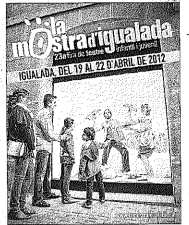
El nou cartell de La Mostra

La nova imatge de La Mostra també fa referència al dinamisme comercial de la ciutat. El comerç ha cedit els seus espais per la gravació de l'anunci televisiu i, a més, aquesta col·laboració serà present també durant els dies de la fira, ja que diferents establiments guarnixen els seus aparadors